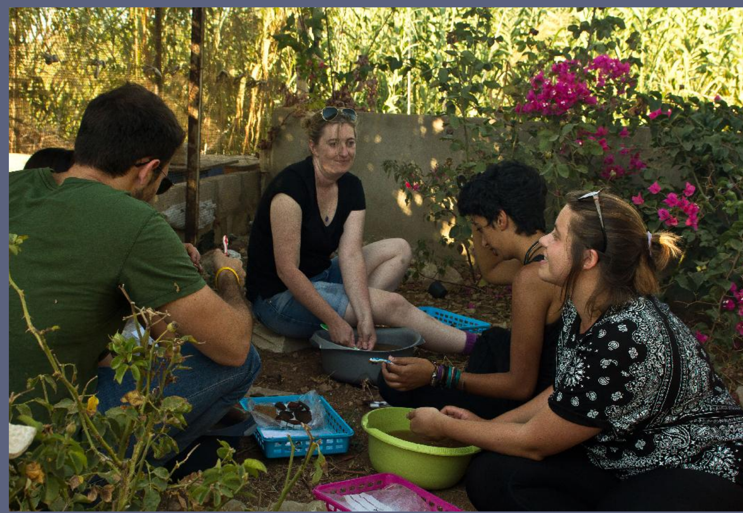
Above: Washing excavated pottery from Tell Koumba I.

في الأعلى : غسل الفخار المستخرج من تل كويبا الأولى.