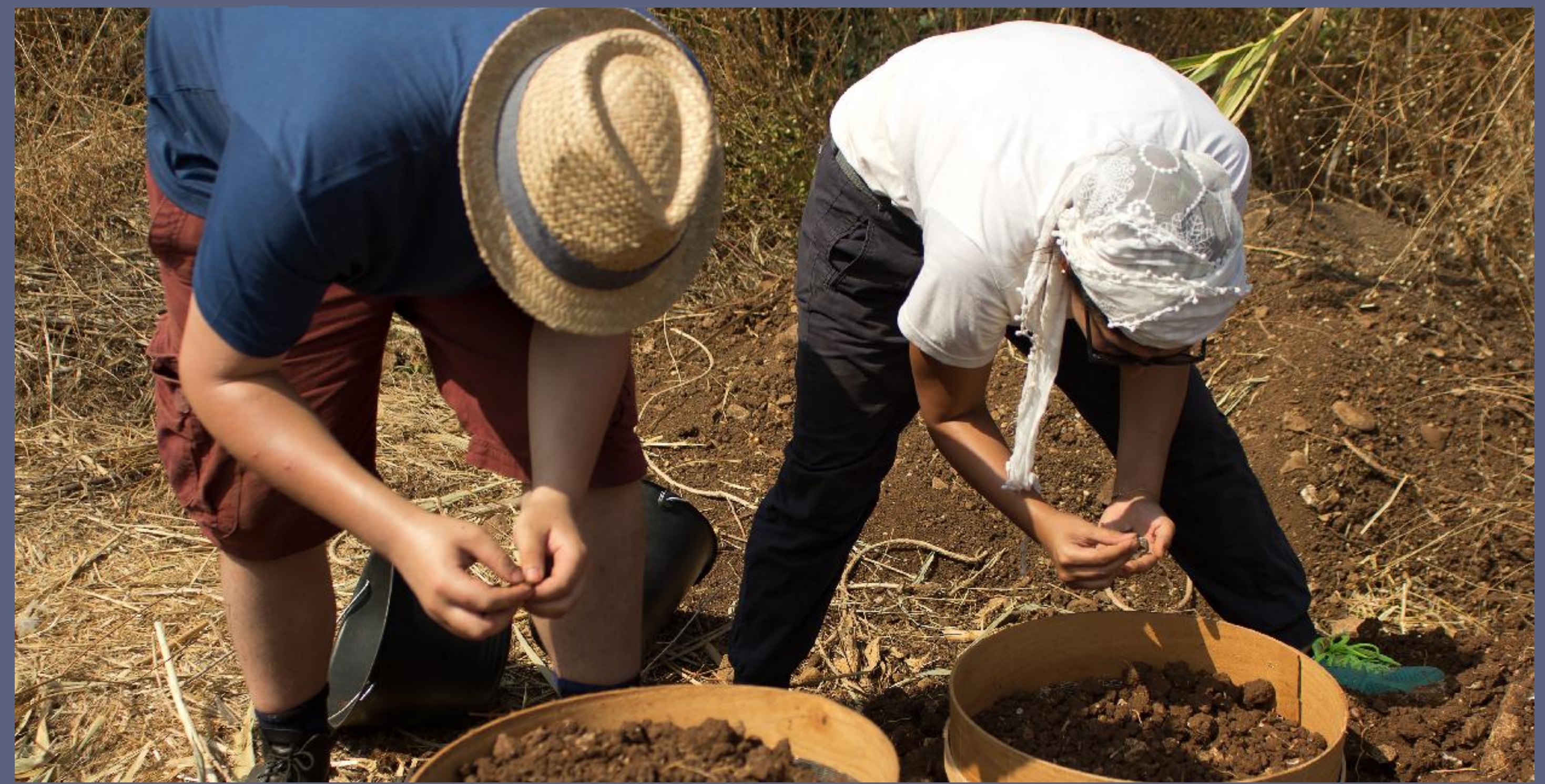
Above: Sieving excavated material at Tell Koumba II to recover artefacts (Photograph: G. Philip).

في الأعلى : غربلة الآثار المحفورة في تل كويبا الثانية لاستعادة التحف الصغيرة (تصوير : ج. فيليب).