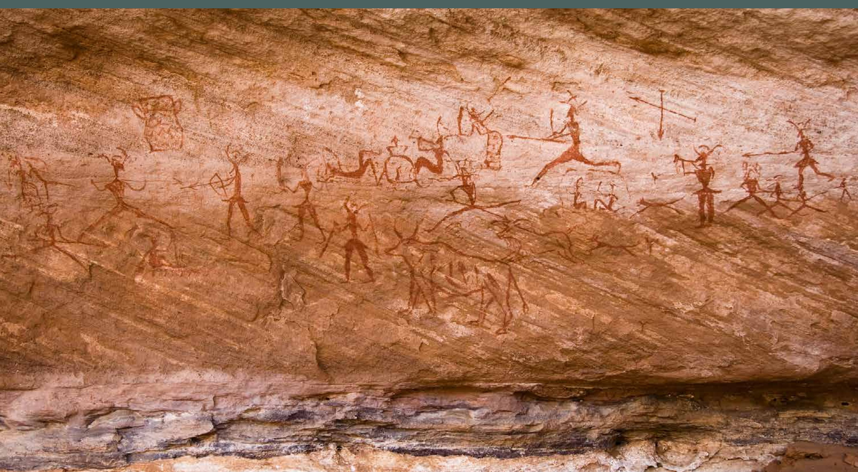
Right: Rock art drawing of people hunting animals, Tadrart Acacus.