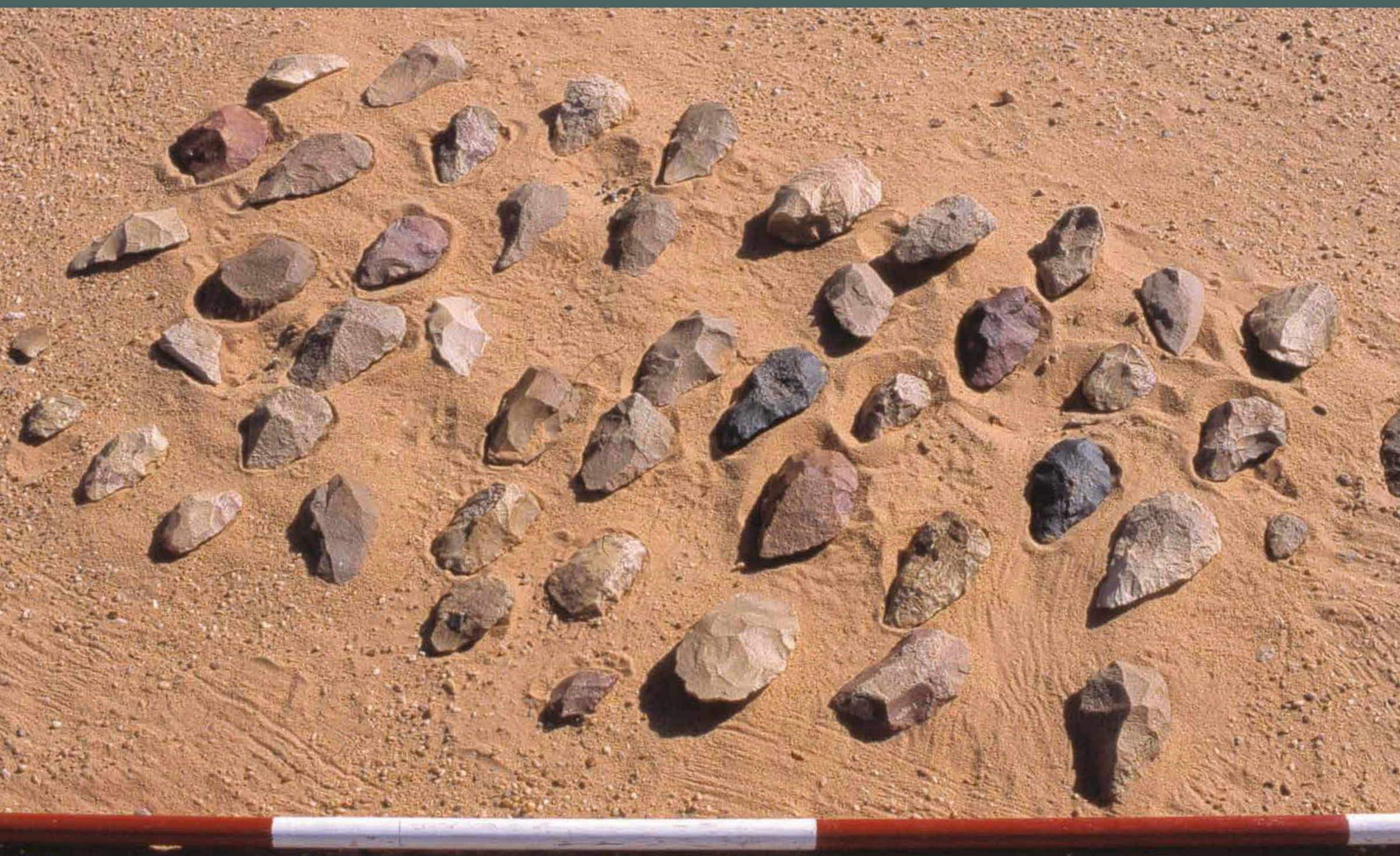
Right: Tools made from stone were already used by humans over a million years ago. Examples like these stone axes became ever more complex over time. اليمن: استخدمت الأدوات المصنوعة من الحجر بالفعل من قبل البشر منذ أكثر من مليون سنة. مثل هذه الفؤوس الحجرية أصبحت بمرور الوقت أكثر تعقيداً.