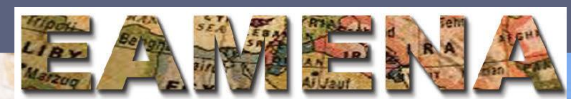
الصورة في الأسفل: افتتاح ورشة عمل إيمينا لفلسطين والأردن في عمان، كانون الثاني 2018.