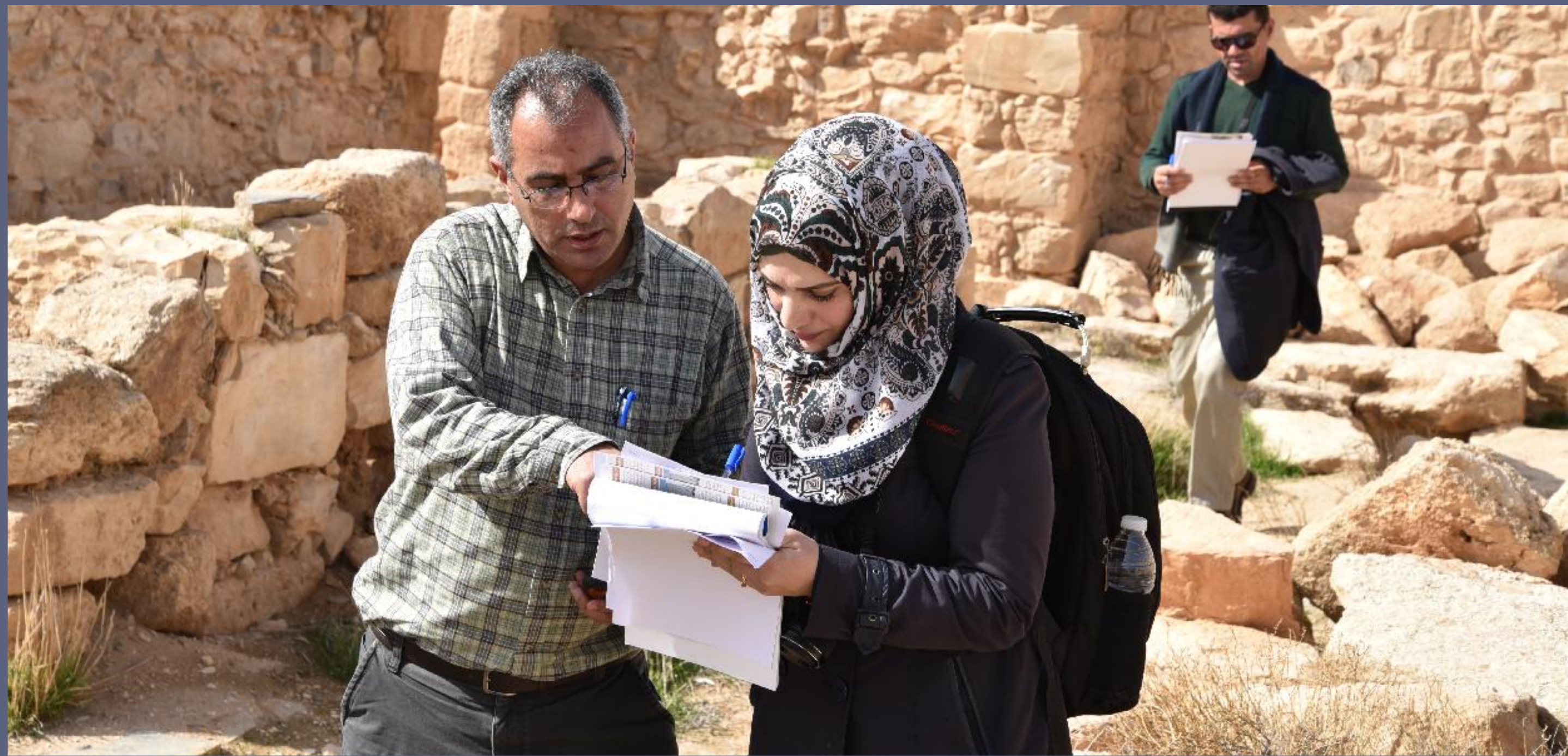
Above: Explaining how to complete an assessment form during a site visit.