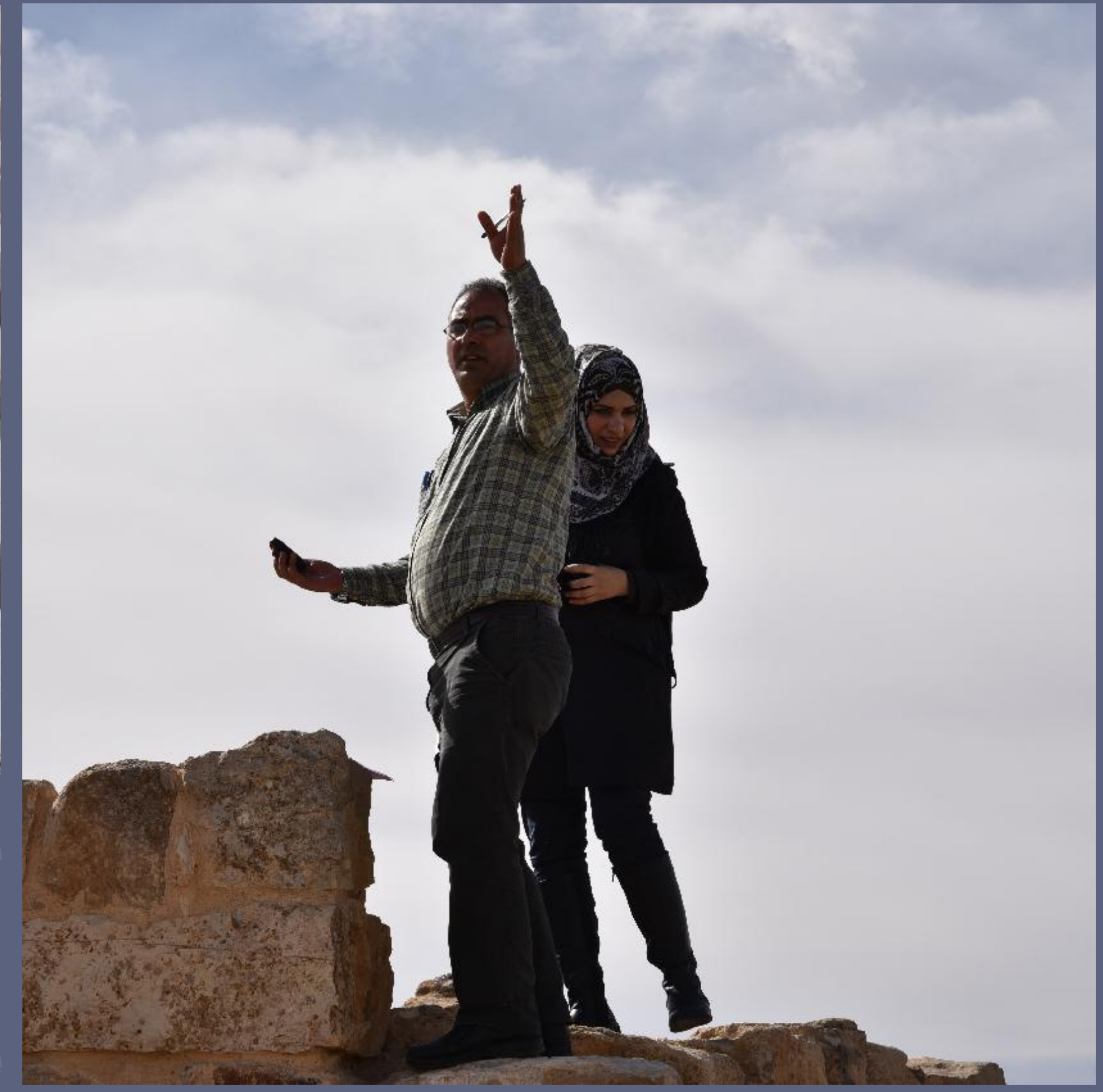
يمين: الأثريين يستخدمون جهاز تحديد المواقع محمول باليد لتسجيل إحداثيات الموقع الأثري خلال نشاط ميداني.